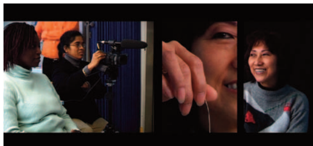
“Langues vivantes.” Triptyque Vidéo 2007.