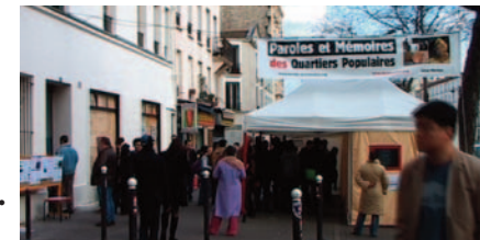
“Les Voix de Belleville” Installation Vidéo de rue, avril 2008.

L'expression populaire s'approprié le mode de l'installation vidéo : les montages proposés dans l'exposition ont été présentés dans l'espace public, dans la rue, dans les quartiers populaires, à Paris et en banlieue.