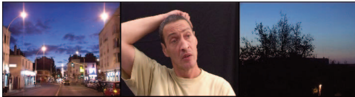
“Paroles de Sans Voix de Villejuif” Triptyque Vidéo