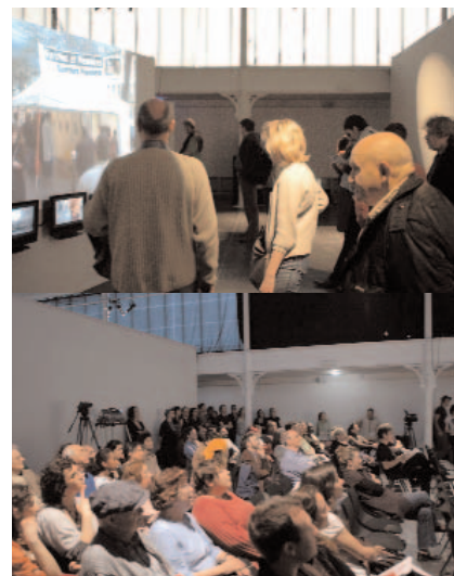
L'Upopa à la Maison des métallos en 2012

Un partenariat Canal Marches - Centre social La Maison du Bas-Belleville Avec le soutien de la ville de Paris et de la Région Île-de-France