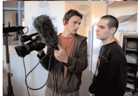
Des ateliers vidéos dans les quartiers